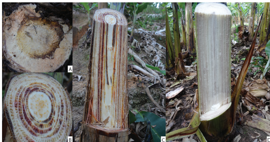
Figura. 3 Sintomas internos do mal-do-Panamá em banana. A. Corte transversal no rizoma mostrando necrose dos tecidos. B. Corte transversal no pseudocaule mostrando necrose avançada do tecido vascular. C. Corte longitudinal do pseudocaule mostrando necrose ao longo dos feixes vasculares. D. Corte longitudinal do pseudocaule em planta de bananeira sadia.