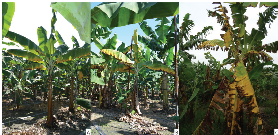
Figura 2. Sintomas externos do mal-do-Panamá em banana. A. Planta da variedade Cavendish infectada pela raça 4 tropical mostrando amarelecimento inicial nas folhas mais velhas. B. Planta da variedade Cavendish infectada pela raça 4 tropical mostrando amarelecimento generalizado. C. Planta da variedade Cavendish infectada pela raça 4 tropical mostrando amarelecimento avançado e murcha das folhas mais velhas.

No pseudocaule pode ocorrer rachaduras longitudinais (Figura 2B). Nos frutos não há sintomas.